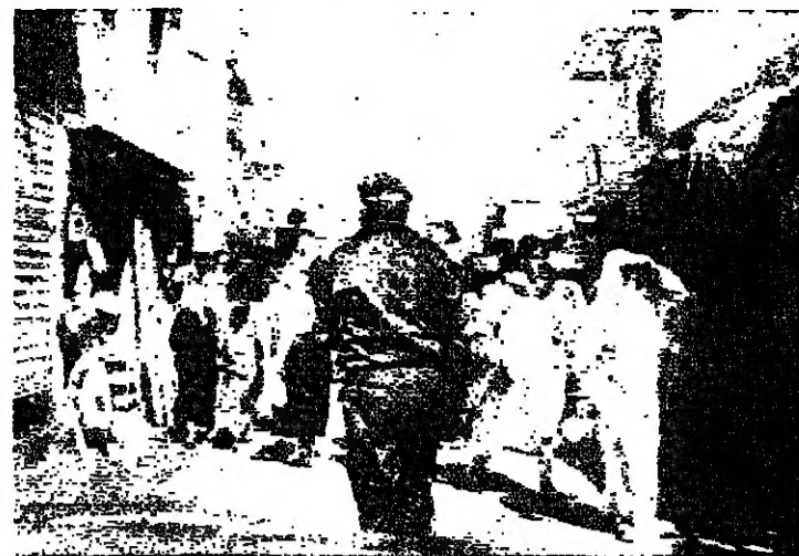
حركة عينية في عين الحلوة